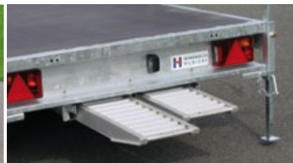
Logement de rampes, rampes, béquilles