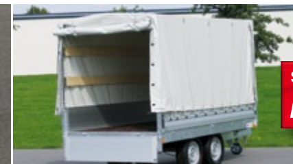
Ridelles aluminium et bâche haute