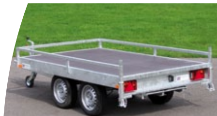
Galerie 3 faces

En plus de leurs qualités techniques, ces remorques proposent en série un plancher bois antidérapant, une flèche en V et un éclairage encastré. Cette gamme propose de nombreuses options (ridelles aluminium rabattables et amovibles, bâche haute, galerie, rampes...).