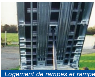
Logement de rampes et rampes