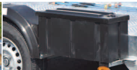
Coffre de rangement