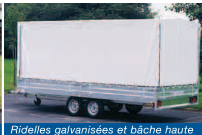
Ridelles galvanisées et bâche haute