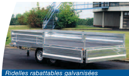
Ridelles rabattables galvanisées

Cette gamme propose de nombreuses options (galerie, ridelles amovibles et rabattables, bâche haute, timon réglable parallélogramme...).