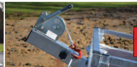
Support de treuil et treuil manuel