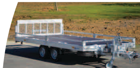
Galerie d'arrimage 3 faces + points d'ancrage

Cette gamme permet de nombreuses options (ridelles rabattables et amovibles, ridelles grillagées, timon réglable parallélogramme...).