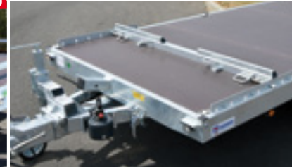
Cale de roue réglable