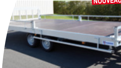
Galerie rabattable latéralement