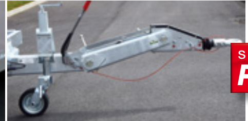
Timon réglable parallélogramme surbaissé OPTIMA