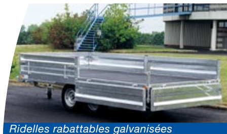
Ridelles rabattables galvanisées

Cette gamme propose de nombreuses options (galerie, ridelles amovibles et rabattables, bâche haute, timon réglable parallélogramme...).