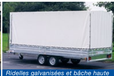
Ridelles galvanisées et bâche haute