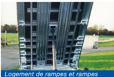
Logement de rampes et rampes